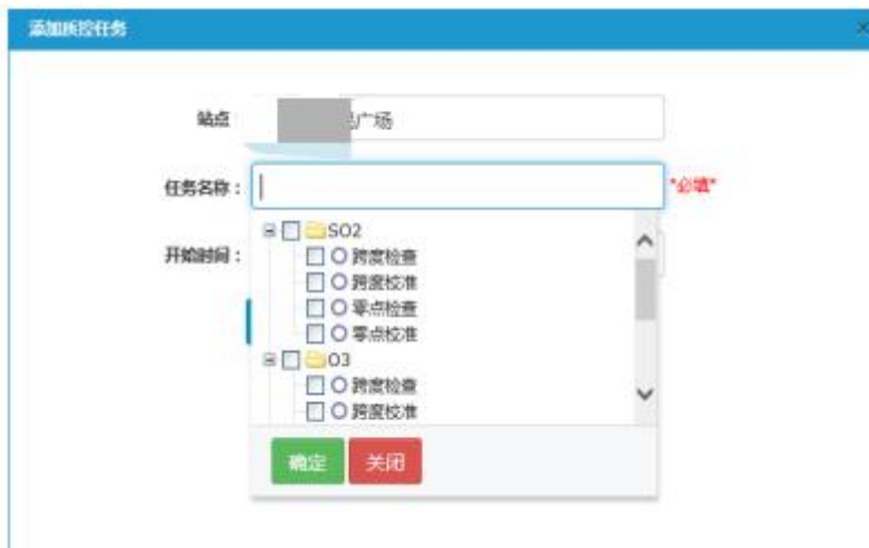
远程质控添加任务示意图

系统提供监测站点远程监控管理功能，实现对站点远程质控功能，实现对站点的质控状况、质控报表查询功能。系统支持对子站仪器质量控制工作进行任务集中式的管理，以实现质控工作的流程化和自动化，可通过平台远程对仪器执行精度检查、跨度检查、跨度校准、零点检查、零点校准等质控工作。远程质控指令下达后，系统提供起止时间、质控结果、目标值、响应值、误差等质控过程的数据查询。同时，系统提供以执行合格次数、执行达标率、数据获取率为标准的质控结果评价功能，并汇总数据，形成一览式可供下载的网络化质控评价表。