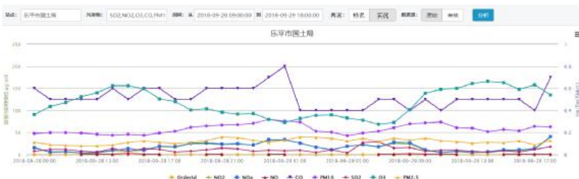
单站点多污染物分析示意图

系统提供对各站点数据进行图形分析，包括：单站点多污染物分析、多站点多污染物参数分析、相关性分析、过程分析、气象参数分析（风向玫瑰图）等，并以图形形式展示。