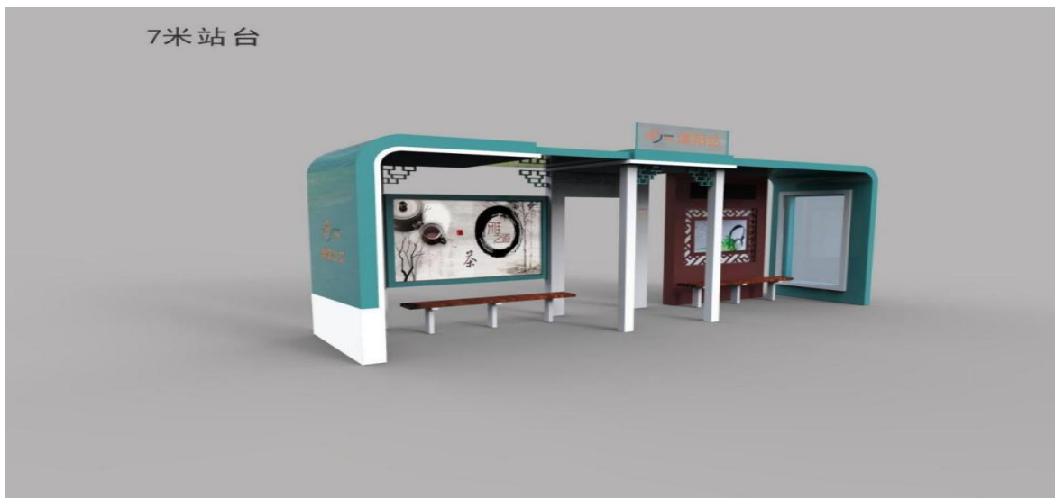
7 米候车亭效果示意图

主要由无线网络建成的 INTERNET 专用网络为主，将公交智能电子站牌系统、控制中心系统平台以及公交调度系统连接起来。