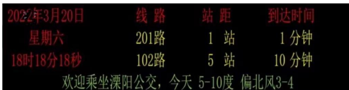
LED 电子站牌显示效果