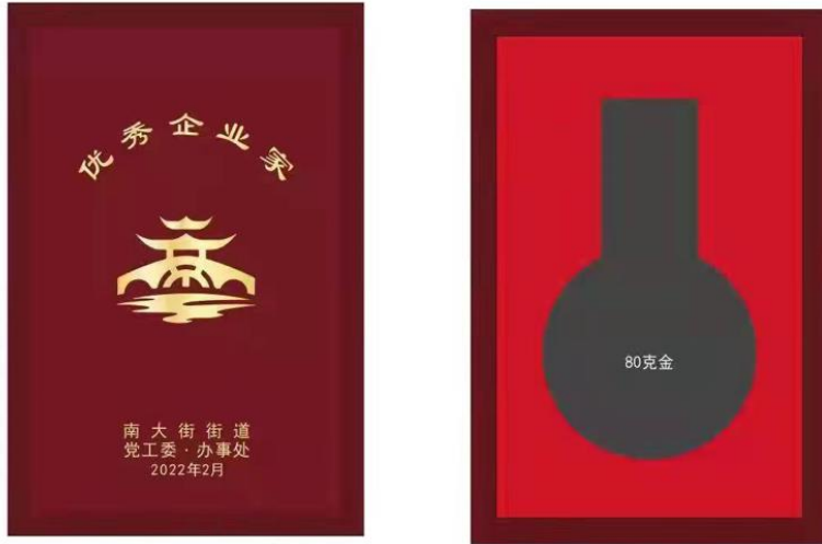
尺寸：140X200mm 仿红木色木盒，盒面上印金色 枣红色天地盖纸盒不烫字色