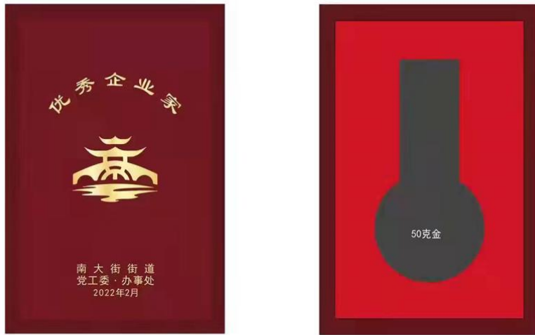
尺寸：140X200mm 仿红木色木盒，盒面上印金色 枣红色天地盖纸盒不烫字色