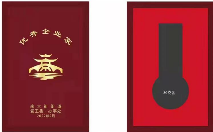
尺寸：100X150mm 仿红木色木盒，盒面上印金色 枣红色天地盖纸盒不烫字