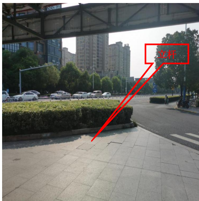
图 1-1 监控杆位置