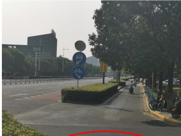
图 1-2 监控飞龙东路通江南路西北角过往行人与车辆