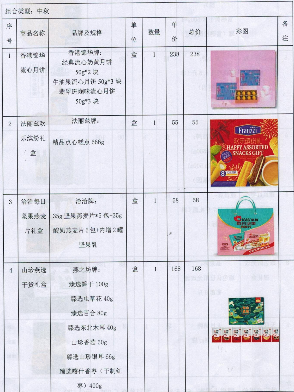
商品供货分项报价表-中秋（福利组合二）