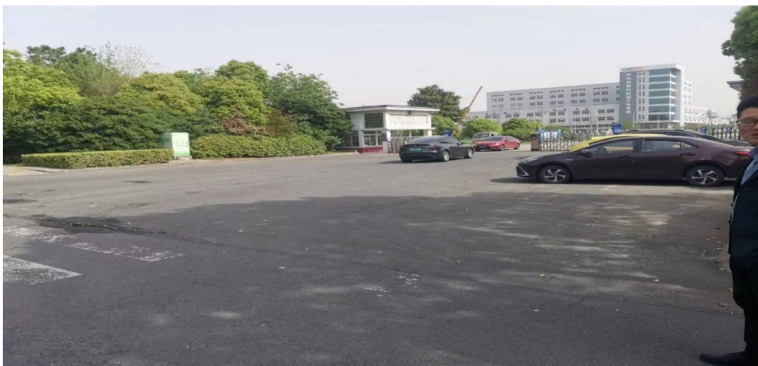
下客站：金瑞达科技大门