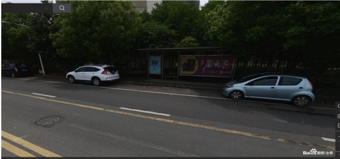
下客站：钟楼公交中心站北行站