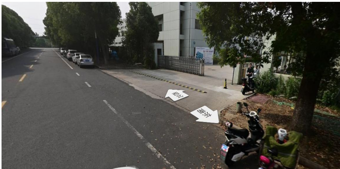
上客站：昌瑞西南门