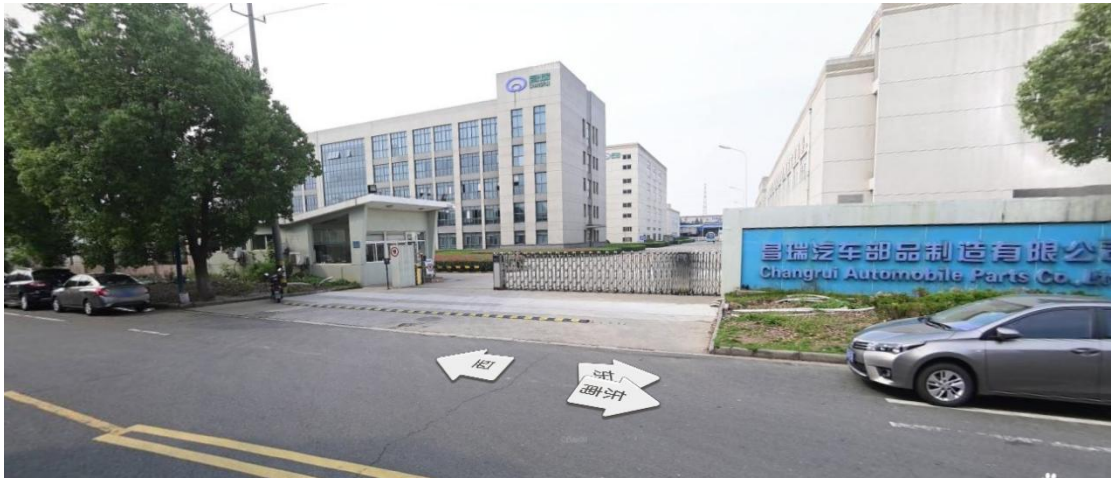
下客站：昌瑞东南门